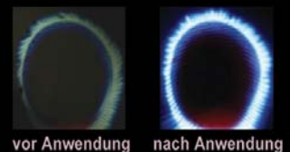
vor Anwendung nach Anwendung