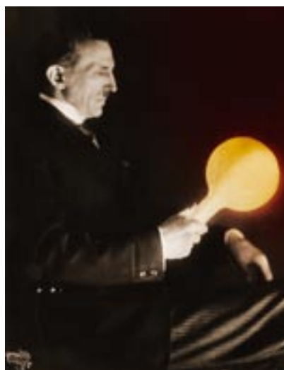
Vom „Geistesblitz zur Erleuchtung“: Tesla demonstriert hier eindrucksvoll die drahtlose Energieübertragung mit einer Glühbirne

Tesla wollte nun einen Weg zu finden, die Tachyonen „künstlich“ abzubremsen und konzentriert einzufangen. Dafür konstruierte er eine spezielle Platte, die durch ihre mikrokristalline Oberfläche ein Magnetfeld besonderer Art aufweist.