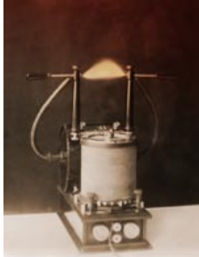
Die Teslaspule: Transformator zur Erzeugung hochfrequenter Wechselströme mit hoher Spannung

Um diese Energie für die Menschheit nutzbar zu machen, befasste sich Tesla in einer seiner Arbeiten ausgiebig mit dem Schuhmann-Feld, das sich zwischen der Ionosphäre und der Erdoberfläche be-