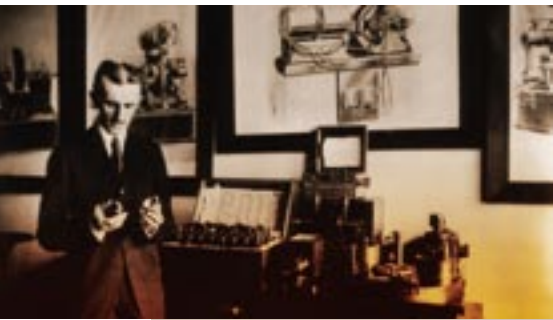
Der geniale Erfinder Nikola Tesla meldete in seinem Leben mehr als 700 Erfindungen zum Patent an

Die Leistung des Pierce Arrow war der eines Autos mit Benzinmotor zumindest gleichwertig, ohne Treibstoff zu benötigen oder Abgase zu erzeugen! Für Tesla war das Freie-Energie-Auto aber nur eine Freizeitbeschäftigung, denn er wusste, dass die Zeit dafür nicht reif war. Es war ihm klar, dass auch dieser Fortschritt keine größere Akzeptanz finden würde, als